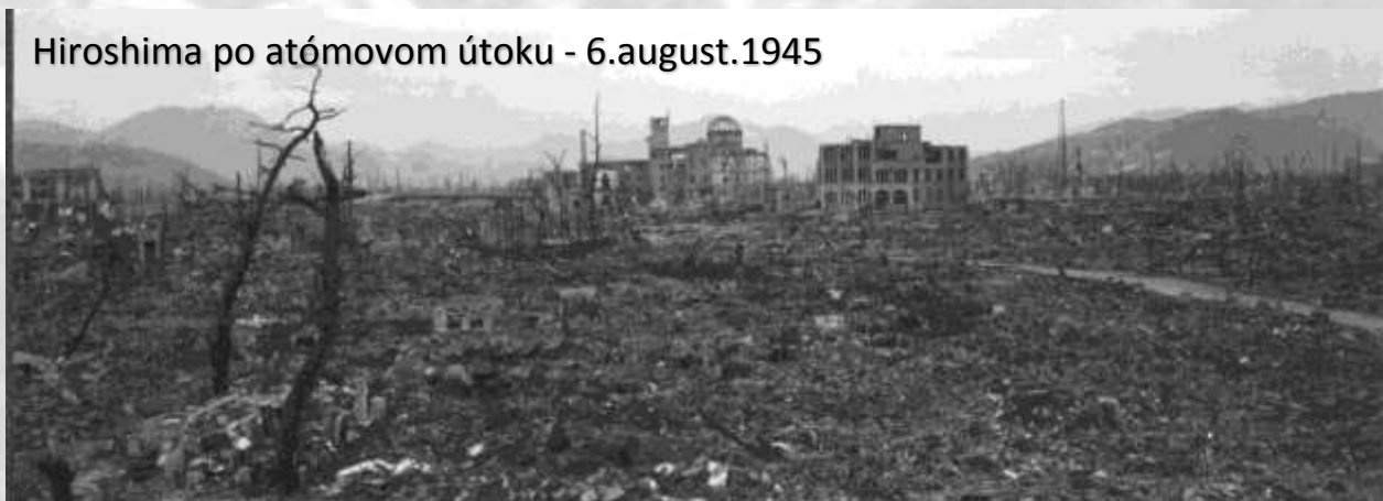
Hiroshima po atómovom útoku - 6.august.1945

Smutná štatistika hovorí o 105 vypálených obciach a 211 masových hrobch na Slovensku počas obdobia 2. svetovej vojny.